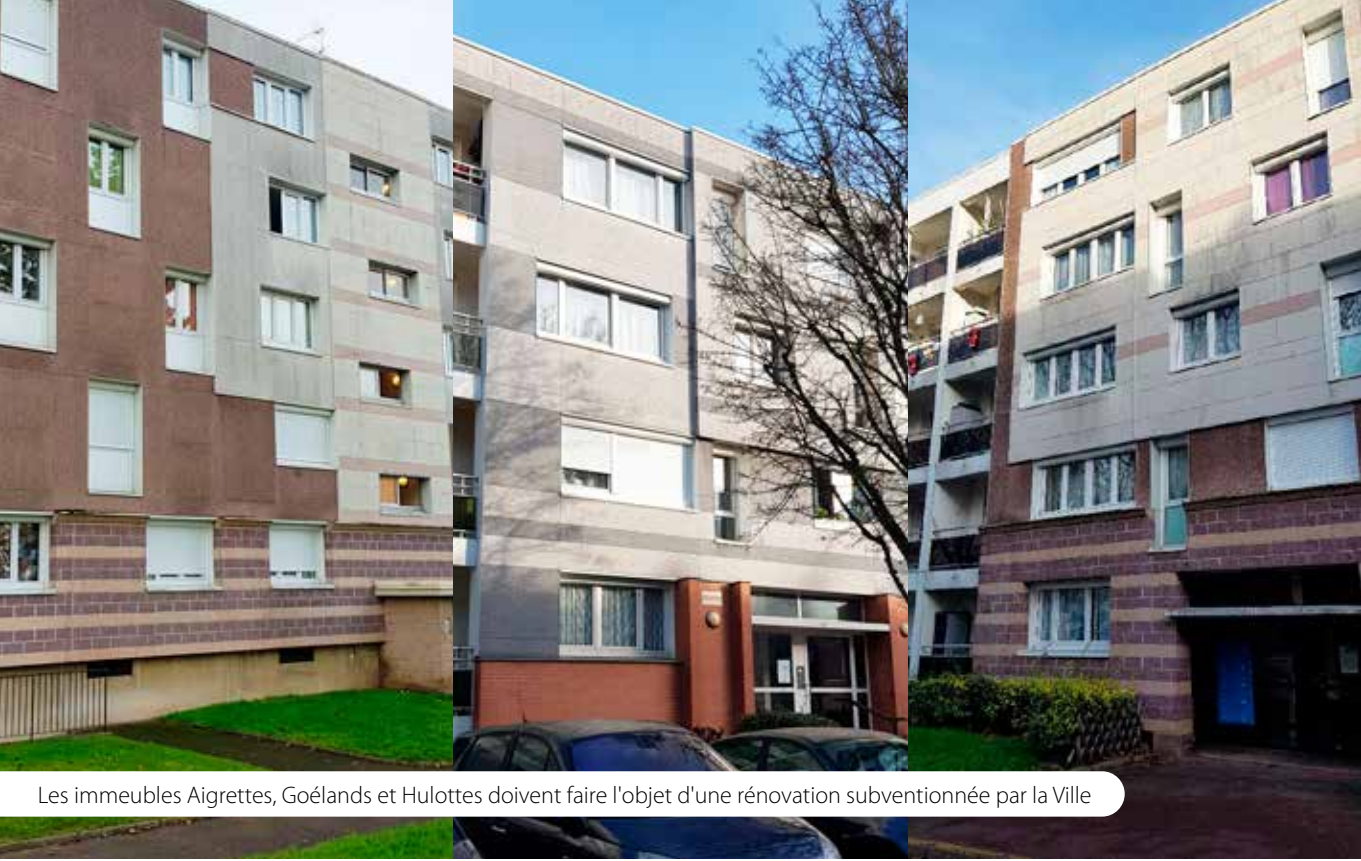
Les immeubles Aigrettes, Goélands et Hulottes doivent faire l'objet d'une rénovation subventionnée par la Ville